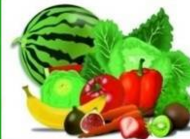
СВЕЖИЕ ОВОЩИ И ФРУКТЫ